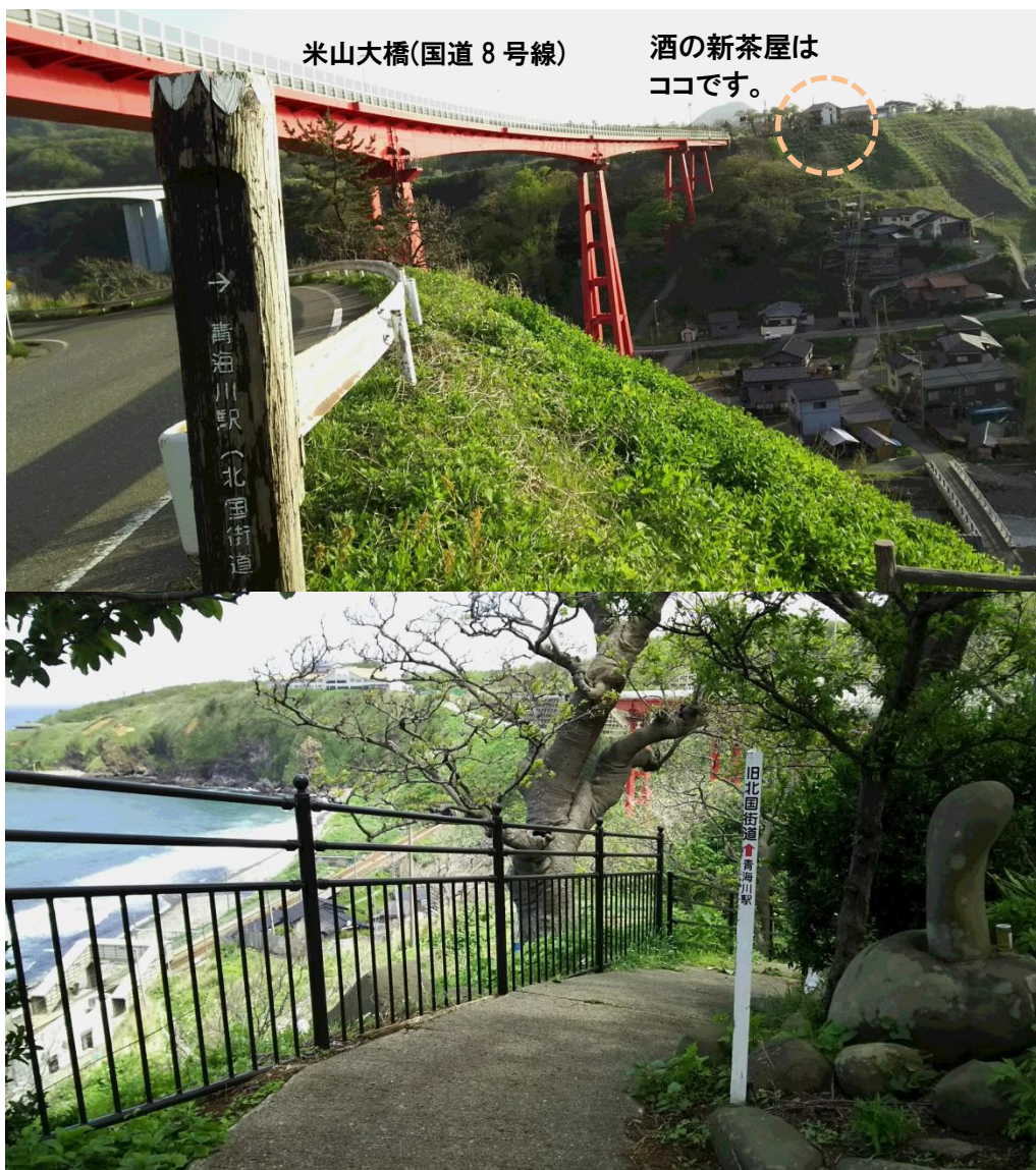
米山大橋(国道 8 号線)